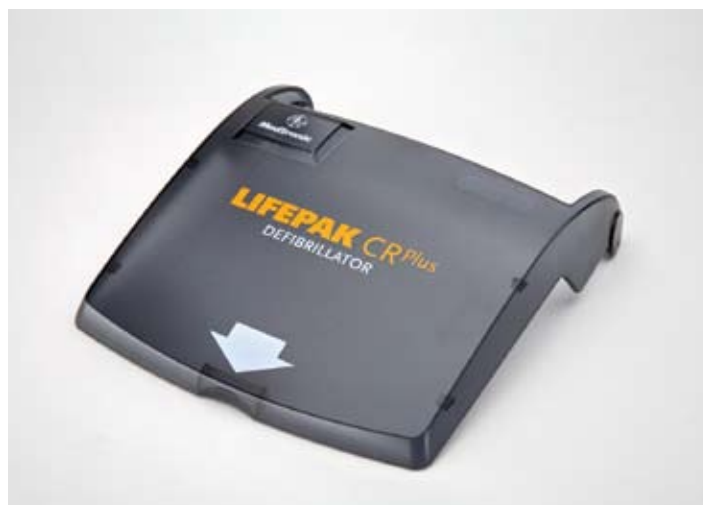
Bijkomende gleuf .....21300-004913