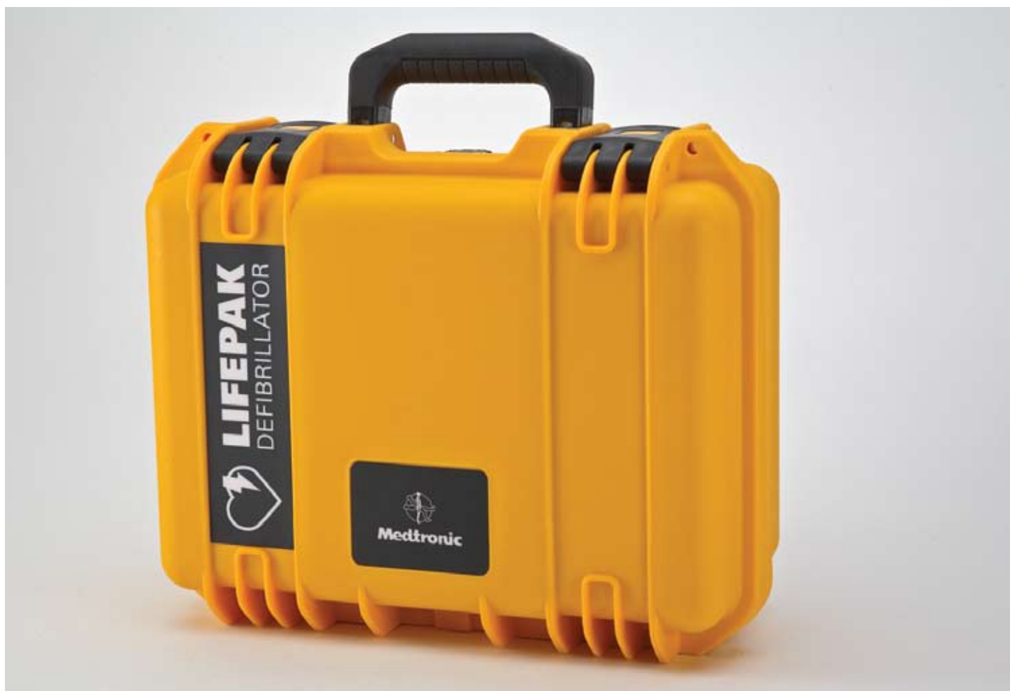
Waterdichte koffer .....11260-00015

Voor LIFEPAK CR Plus/LIFEPAK EXPRESS AEDs