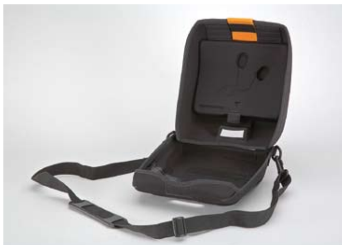
Complete zachte Draagbare tas .....21300-004576